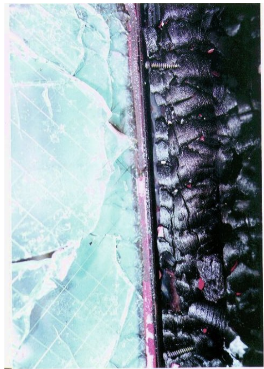
試験後(ガスケット部拡大)